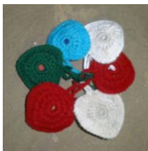
Le lot de 6 cœurs assortis : 4€.

Les villageoises ont pensé créer des décorations afin de parer nos sapins de Noël. Nous sommes très touchés par cette initiative. Merci de noter que les décorations peuvent aussi être utilisées comme porte-clés. Nous prendrons livraison lors de notre voyage en octobre. Si vous souhaitez les encourager et les aider à améliorer leur quotidien grâce à leur travail, merci de passer commande en envoyant un petit message sur le site, la page FB ou par courriel.