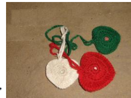
Un porte-clés « cœur » : 1€